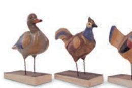
■ 18. Jh. | Sonneberg ■ Ende 18. Jh. | Gröden ■ um 1920 | Sachsen ■ 1914 | Judenbach

■ Seit 1830 gewann Porzellan für die Herstellung von Puppenköpfen Bedeutung. Kugelgelenke, Stimmen und Schlafaugen ließen die Puppen immer menschenähnlicher werden. Sie entstanden meist nach dem Vorbild der bürgerlichen Dame. Einen kindlichen Puppentyp schufen Münchner Künstler am Anfang des 20. Jahrhunderts. Diese Reform regte Fabrikanten zur Herstellung von „Charakterpuppen“ an. Zelluloid fand als erster Kunststoff seit 1896 Eingang in die Puppenherstellung.