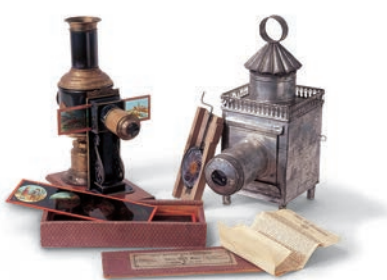
■ um 1890 | Nürnberg, Plank ■ um 1845 | Paris, Lapierre

■ Fondé en 1901 en tant que «Musée industriel et artisanal de la région de Meiningen», le musée allemand du jouet passe pour être la plus ancienne collection spécifiquement consacrée aux jouets dans toute l'Allemagne. Dans la seconde moitié du XIXe siècle, la ville de Sonneberg s'est développée comme un centre international de fabrication et de commerce de jouets. Il était donc logique que le musée, dont nous sommes redevables à l'enseignant Paul Kuntze (1867–1953), soit consacré aux produits de cette industrie.