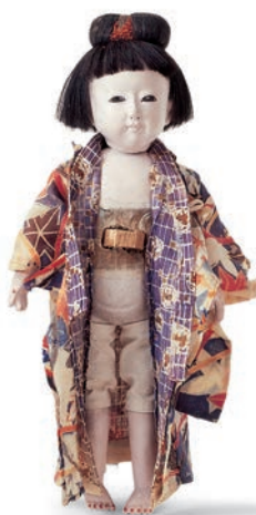
■ 4. Jh. v. Chr. | griechisch ■ 1377–1360 v. Chr. | ägyptisch ■ um 1850 | Japan

■ Einfache gedrechselte und geschnitzte Puppen aus den Alpentälern, aus Böhmen, dem Erzgebirge und dem Sonneberger Gebiet galten über Jahrhunderte als charakteristische Spielpuppen. Im 19. Jahrhundert erlaubte die Verwendung plastischer Massen (Teig, Papiermâché) eine zunehmend feinere Gestaltung. Der Einsatz des Werkstoffs Papiermâché machte die Puppenherstellung zum wichtigsten Zweig der Sonneberger Industrie.