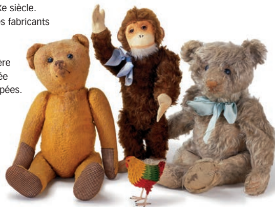
■ 1900–10 | Waltershausen, Kämmer & Reinhardt ■ Lichte, Heubach ■ Sonneberg, Marseille ■ 1912 und 1910 | Käthe Kruse ■ 1900–11 | unbekannt ■ Sonneberg, Leven & Sprenger ■ Glengen/Steiff