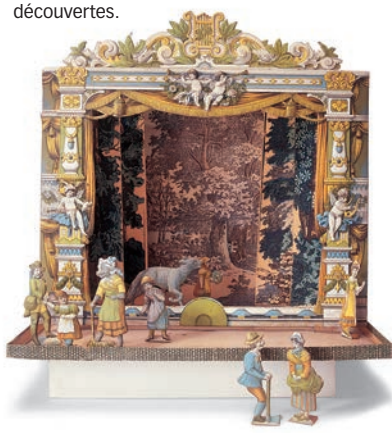
■ um 1900 | Deutschland

■ Savez-vous à quoi ressemblait un jouet, il y a 5.000 ans? Vous êtes-vous déjà émerveillé(e) devant la délicatesse de teint et la tendresse d'expression d'une poupée en biscuit de porcelaine? Avec-vous jamais vu des figurines de «Lilliputiens» en pâte à sel? Le musée allemand du jouet vous fait voir ces pièces originales, et bien d'autres curiosités encore. Si, pour les aînés, sa visite est un retour au temps béni de l'enfance, les enfants eux-mêmes voyageront dans l'histoire du jouet et y feront d'incroyables découvertes.